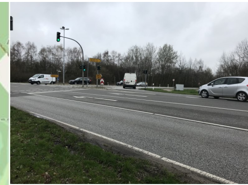
Abbildung 3: Vorsicht beim Straßenqueren an der Fußgängerrampe!

Detailpläne finden Sie unter https://www.wentorf.de/Bildung-Kinder-und-Jugend/Schulwegplanung