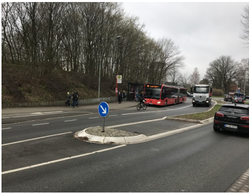
Abbildung 1: Hier soll von den Fahrradfahrern die Überquerungsinsel beim Straßenwechsel vor der Bushaltestelle benutzt werden!