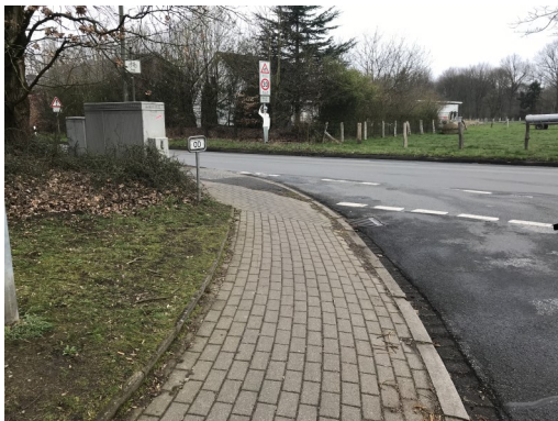
Abbildung 2: Hier kann es eng und unübersichtlich beim Abbiegen werden!